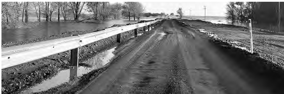
Las condiciones climáticas tan adversas, le han jugado un muy mala pasada a La Pampa en 2017 y hoy se están haciendo grandes esfuerzos por encontrar soluciones.

Se desaprovecharon 34 años maravillosos del regreso a la Democracia, en lugar de hacer las obras necesarias, hubo desinversión.