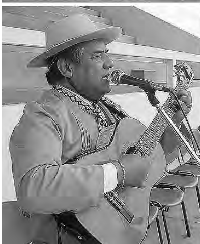
Una verdadera fiesta para disfrutar en familia, sin duda, la expresión popular más genuina que identifica a la provincia de La Pampa.