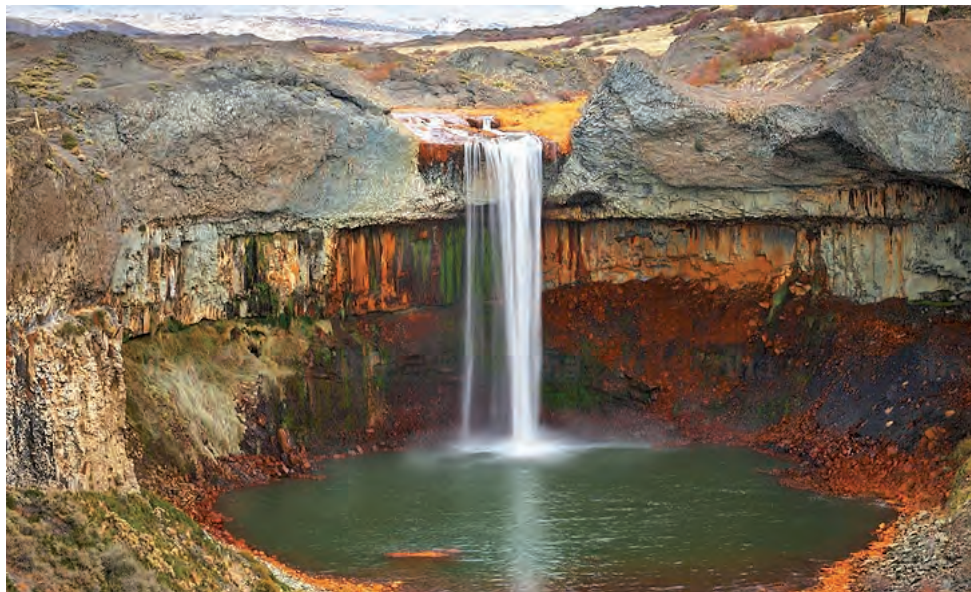
Muy cerca de Copahue, en Caviahue, hay que visitar el Salto del Agrío. Es un sitio para una foto imperdible donde se aprecia como el agua sulfurosa horada la roca.

Los tratamientos que se realizan están asesorados por profesionales del servicio médico del complejo termal, combinando las diversas aguas mineromedicinales y sus derivados, vapores, fangos y algas: balneoterapia (baños de inmersión, hidromasajes, hidropulsores), fango terapia, masoterapia, kinesioterapia y gimnasia.