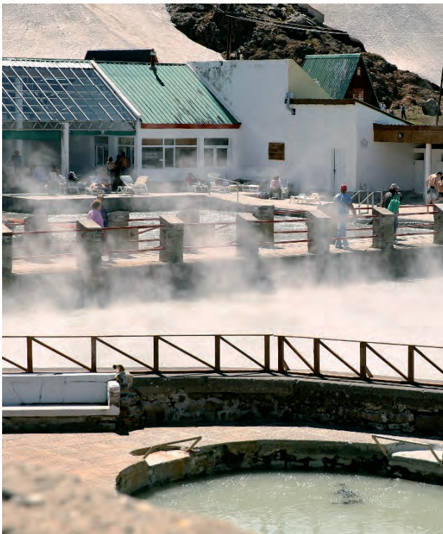
Entre araucarias, aguas sanadoras y la vista imponente del volcán, las Termas de Copahue, al pie de la Cordillera, invita a vivir unas fiestas absolutamente diferentes.

Un volcán siempre activo Las eternas araucarias y las gigantescas rocas dibujan un