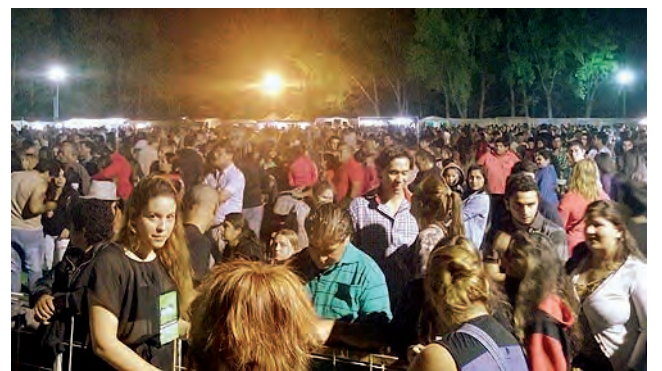
En la edición 2017 asistieron más de 6.000 personas

2º Gran baile: con Los Balseritos de Balsa las Perlas, Los Chamas de Puelén, José Antonio Farías (Santa Isabel). Sorteo de la rifa del festival. Entrada $ 100