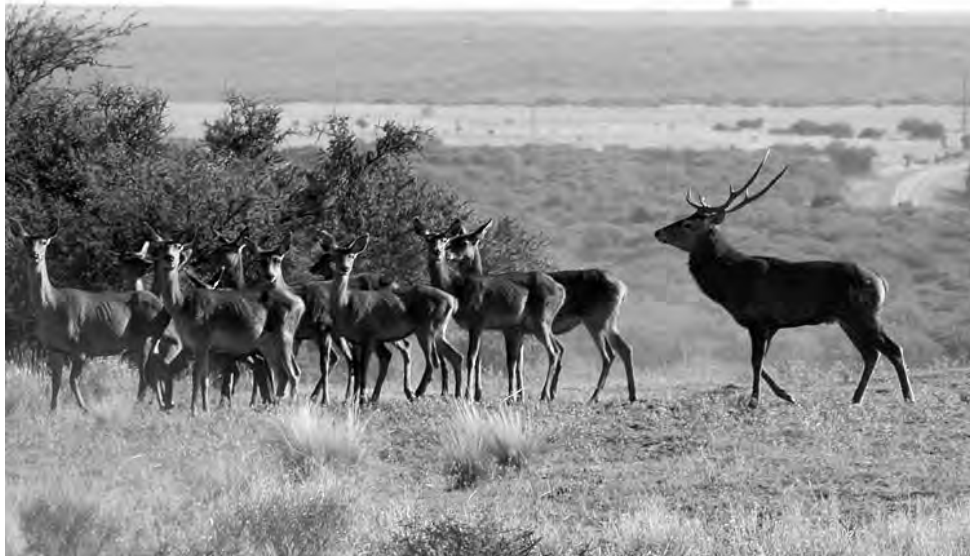
Un macho de ciervo colorado vigila su harén en la Reserva Provincial Parque Luro. Es marzo y ha comenzado la época de la brama.

Como parte de la ceremonia, se espera la proyección de un video institucional de la Reserva Provincial Parque Luro, donde se darán a conocer los horarios de las excursiones diarias, realizadas por un guía especializado que conduce a los grupos hasta los miradores de la Reserva que se han preparado especialmente para esta actividad.