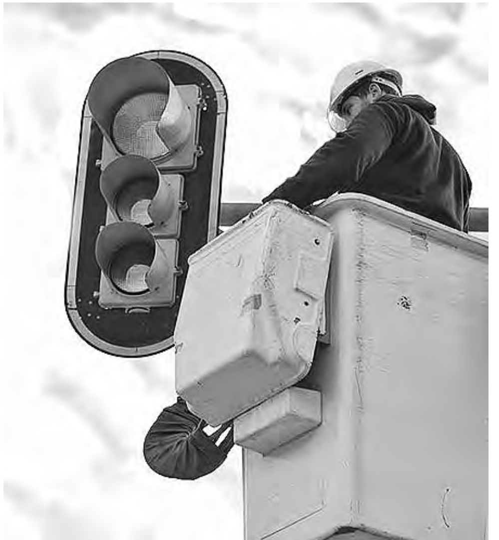
Se colocarán semáforos en las principales arterias de la ciudad de 25 de Mayo, con una inversión de más de $ 9 millones. También la construcción de un multiespacio con capacidad para 150 personas, que podrá ser utilizado como aula virtual, obra que tendrá un costo aproximado a los 12 millones de pesos.

El importante flujo de fondos que ingresa producto de las regalías petroleras que per-