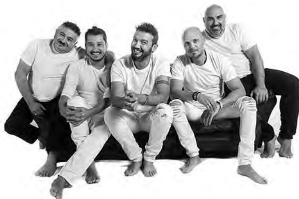
"Los Tekis" cerrarán a noche musical de Jacinto Arauz el sábado 9, para dar paso al humor de Cacho Garay.

El Dr. Favalaro, uno de los cardiocirujanos argentino especialista en corazón más reconocido en el mundo, plasmó para siempre su paso por La Pampa en su libro "Recuerdos de un médico rural", donde cuenta detalles de su vida, la gente y anécdotas que vivió durante su permanencia en Jacinto Aráuz. Hace poco, el 28 de diciembre de 2016, la provincia de La Pampa adhirió a la Ley Nacional 25598 por la cual declara el 12 de julio de cada año, como "Día Nacional de la Medicina Social", en conmemoración por la fecha del nacimiento del doctor René G. Favalaro.