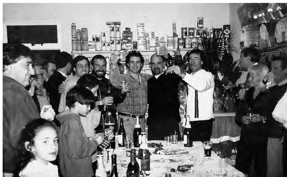
"Los Amigos" y el edificio propio de la actual dirección. Inauguraron el 30 de Julio de 1999.