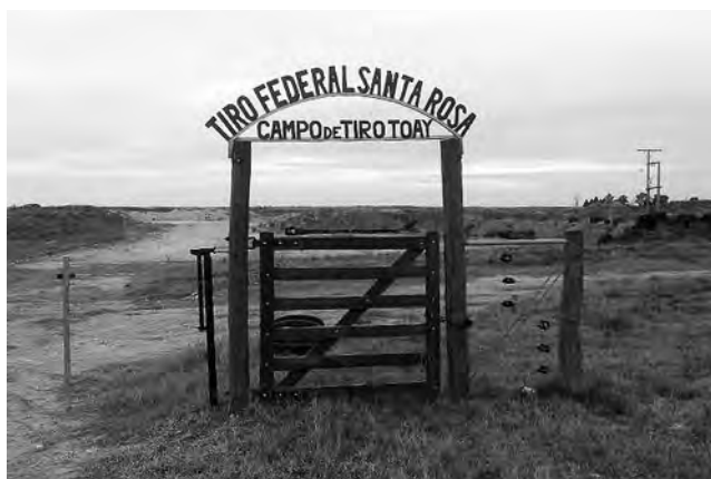
Actualmente el TFSR está ejecutando la obra de construcción de un nuevo Campo de Tiro a la vera de la RN 35.