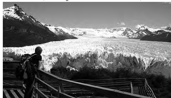
El Calafate, en la Patagonia Argentina.