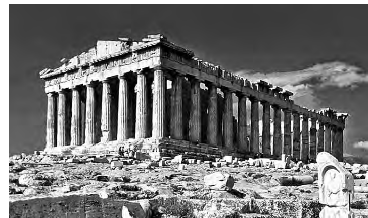
La espectacular Acrópolis de Atenas, Grecia.