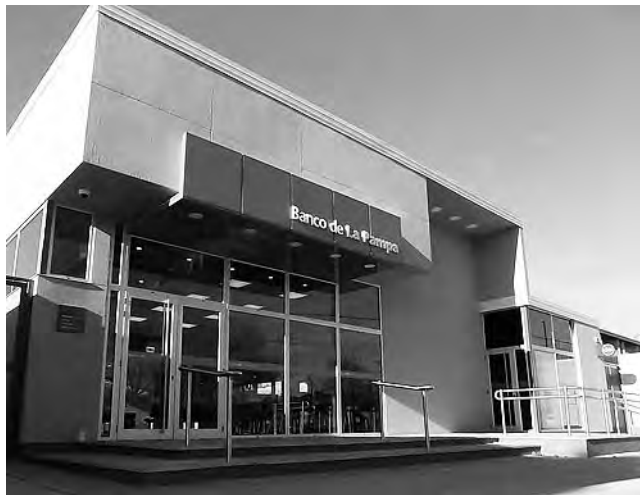
La nueva Sucursal demandó una inversión de $ 43 millones. Son 613 m2 y cuatro cajeros automáticos.

tas puestas a disposición desde el Gobierno y el BLP, el ministro se refirió a las que están fuera de la Provincia, "a través del comercio pampeano, a través de las diferentes sucursales que tiene el Banco fuera donde se hacen rondas de negocios y podemos vincular la venta de nuestra producción, la penetración de otros mercados que hoy han hecho que la actividad económica de La Pampa, si bien está resentida, se siga manteniendo".