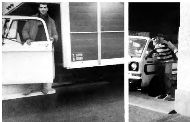
"Los Amigos" en el inicio en la calle Chaco.

"El verano de 1987 fuimos a Villa Carlos Paz, Córdoba, donde pasamos unas hermosas vacaciones -recuerda