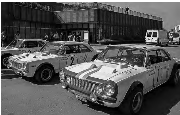
Industrias Kaiser Argentina (IKA), se asoció con Renault en 1959 y en 1966 empezaron a fabricar el Torino, con diseño de Sergio Pininfarina. Su nombre surgió debido a que Pininfarina vivía en Turín (o Torino), en Italia.