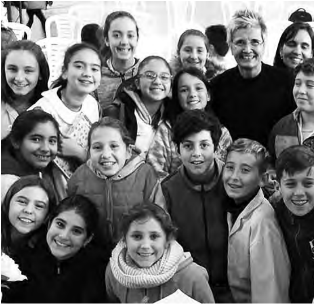
"Para los niños trabajamos, porque los niños son los que saben querer, porque los niños son la esperanza del mundo", José Martí.

La Secretaría de Cultura de La Pampa y varios Municipios pampeanos continúan celebrando el "Mes de los niños" con actividades libres y gratuitas.