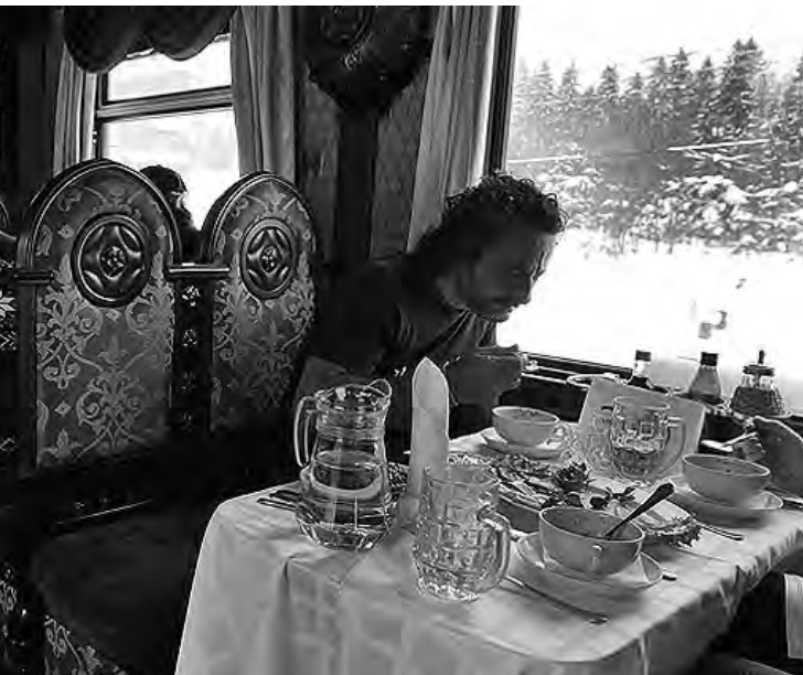
Luces del Norte", son los mismos del Gran Express Transiberiano. ...nsk, a orillas del Océano Glacial Ártico y San Petersburgo. ...en la región nórdica para realizar un recorrido de 3.000 kms.

Desde allí se parte para el pueblo de Lovozero donde habitan los Saami, un pueblo indígena de la península de Kola en donde se aprende sobre la vida en la tundra, la cría de los renos y la caza. La última ciudad de este increíble recorrido es Vologda, famosa por el arte de sus exquisitos encajes, uno de los elementos distintivos del arte popular del norte ruso.