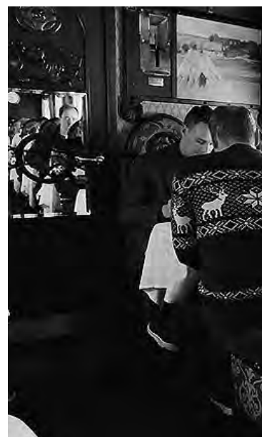
Los vagones del tren "Expreso Recorre Moscú, Múrmansk. Luego el tren se interna

Luego de pasar 1 noche en Moscú y recorrer las principales atracciones de la capital rusa, el tren se interna en la región nórdica para realizar un recorrido de 3.000 kms. Después de una noche a bordo se llega a Apatiti y desde allí a Kirovsk, en donde se puede visitar la villa de Hielo. Allí mismo se accede hasta las cumbres de cerros cercanos para tratar de captar los primeros