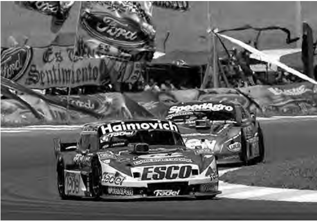
Las multas aplicadas son todas por problemas de comportamiento y en ningún caso modifican las clasificaciones.

La Comisión Asesora y Fiscalizadora de la ACTC emitió un comunicado luego de la 14ª fecha disputada en el Autódromo Provincia de La Pampa, en Toay, resolviendo lo siguiente: