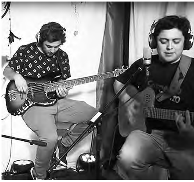
El grupo "La Machada Trío" será el cierre de toda la fiesta.

El pasado lunes 11 en la plaza... General Eduardo Pico, la... Municipalidad de General Pico... desarrolló el acto oficial por el... 114º Aniversario de la ciudad, donde... se entonó el Himno Nacional... Argentino y el Himno Ciudad de... General Pico. Posteriormente se... colocaron ofrendas florales por... parte del municipio y del Concejo... Deliberante. Antes de finalizar el... acto, el Coro de la Tercera Edad... realizó la interpretación de... diferentes obras musicales, entre... ellas la Zamba del río robado.