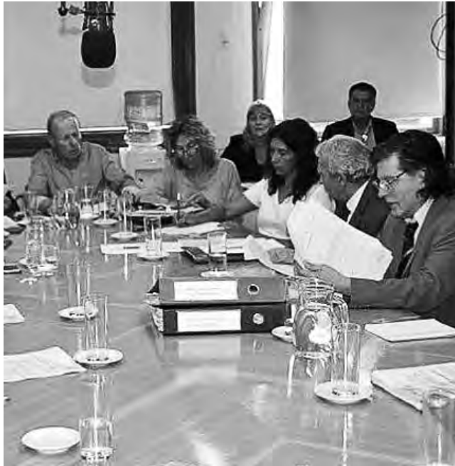
El acuerdo de gobernadores es entre las provincias de Buenos Aires, La Pampa y Río Negro y de aprobarse en su totalidad, en principio se instalará un primer aerogenerador, de 3 mil megas, que será una inversión que hará la empresa Casa de Piedra, según dijo el ministro Bargeró.

La Legislatura Pampeana informó que los diputados de las comisiones de Asuntos Agrarios, Turismo, Obras y Servicios Públicos y de Hacienda y Presupuesto, reunidos en plenario, acordaron por unanimidad emitir dictamen aconsejando la aprobación del proyecto de ley, enviado por el Poder Ejecutivo por el que se aprueba el acta acuerdo de gobernadores y su anexo, suscripta por los representantes de las provincias de Buenos Aires, La Pampa y Río Negro - Modificar el Estatuto Orgánico del Ente Ejecutivo Presa de Embalse Casa de Piedra.