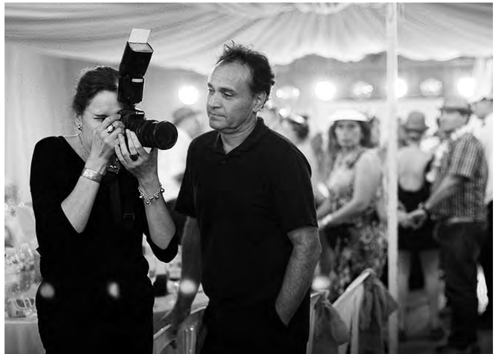
La industria de eventos en general en la Provincia nuclea más de 1.600 trabajadores de diferentes rubros. La actividad está asociada a más de 300 empresas pampeanas.

Es un rubro que implica la aglomeración de personas. Fue el primero en suspenderse y será el último en volver. Todos los encuentros fueron postergados desde la segunda semana de marzo y la situación es crítica en el sector. La pandemia golpea, eventos sociales, corporativos, empresariales, infantiles y una lista larga de entretenimientos de todo tipo que fueron programados en La Pampa en este 2020.