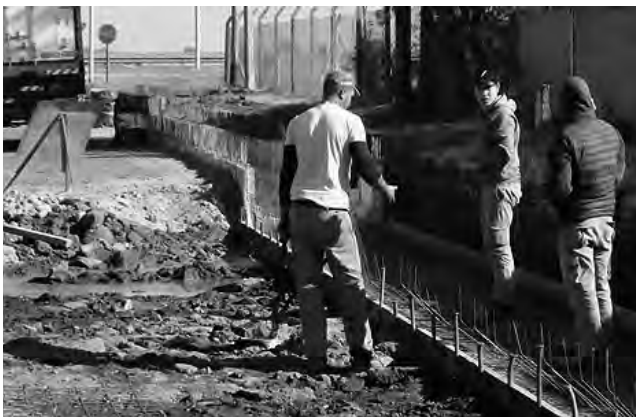
En cuanto a los desagües pluviales en General Pico, están trabajando en cuatro puntos muy importantes de la ciudad, la calle 311 entre 308 y 306, la 303 entre 306 y 308, en la Avenida San Martín y Circunvalación, y en la calle 36 y la Ruta Provincial 1.

"Sobre cuadras sin asfaltar es una deuda que vamos a cancelar a la brevedad, es una obra de 550 millones de pesos denominada Conservación y Pavimentación Urbana de Ge-