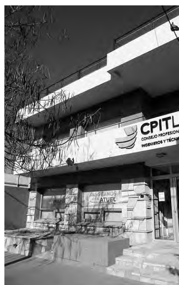
Sede General Pico del Consejo Profesional de Ingenieros y Técnicos de La Pampa

"Esta Secretaría tiene mucho del tema (ingeniería), la ciudad de General Pico se divide en dos grandes grupos, que es la parte de arquitectura y la parte de infraestructura, la cual nuestra ciudad crece en forma súper vertiginosa, así que nosotros tenemos que ir acompañando ese