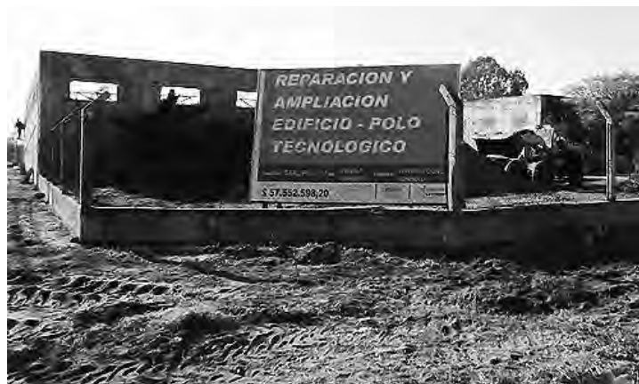
El Polo Tecnológico y Productivo de General Pico es una obra ya adjudicada a la empresa Góndolo Construcciones que ya empezó con los primeros movimientos.

Calle 24 N°1275 - Tel: (02302) 324184 / 15548894 General Pico - ctarpin@estudioarcco.com