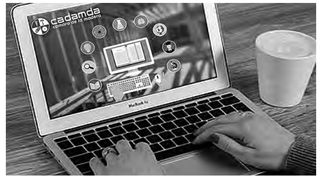
VIENE DE TAPA

Las mayores cifras están en Buenos Aires, con un total de 97 personas, le siguen Córdoba y Río Negro. También se anotaron personas de Jujuy, Chubut, Santa Fe, La Pampa, Tucumán, Mendoza, Neuquén, Entre Ríos, Tierra de Fuego, Chaco, Formosa, Misiones, Corrientes y Santiago del Estero. Casi todo el país interesado en cómo adquirir o mejorar sus nociones del trabajo de construcción con madera. De hecho, el curso ha sido dictado tanto a Arquitectos e Ing. Forestales como a personas sin conocimientos previos en el tema.