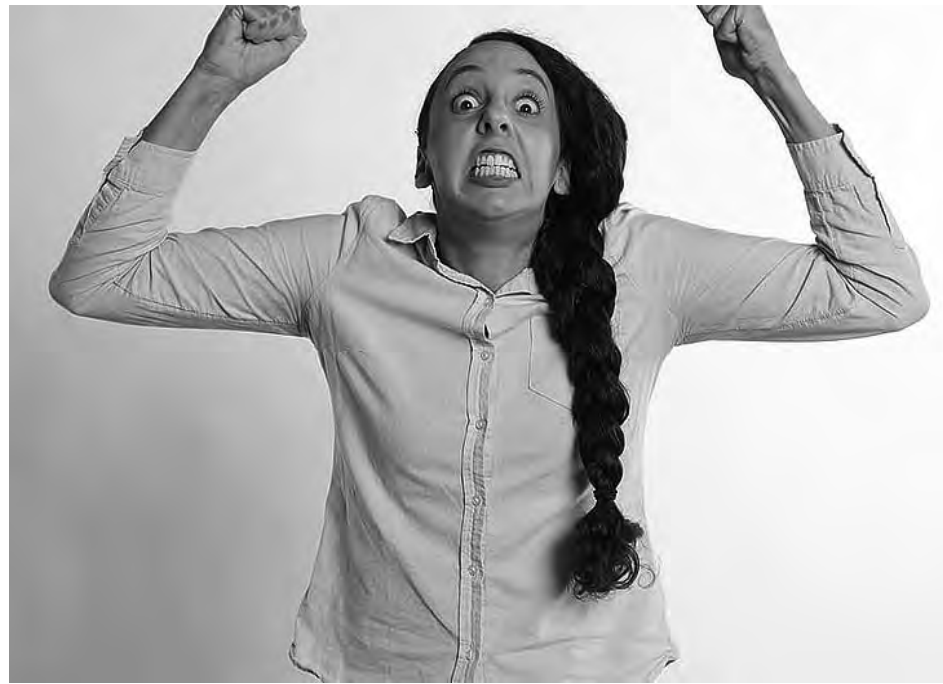
Entre que los chicos están sin clases y que no podemos salir de paseo, crece la histeria ciudadana. Finde largo de julio y vacaciones de invierno ¿se frustrarán en 2020?.

A todo esto, recordemos que estaban programadas las denominadas "vacaciones de julio", que es el receso