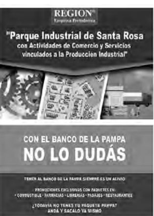
Banco de La Pampa

Complementa el material un Croquis de Ubicación y cómo llegar a las instalacio-