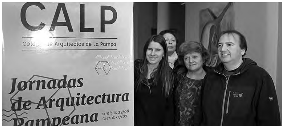
El CALP está en permanente actividad. Tras la charla técnica 'Cómo Diseñar con Paneles SIP', ahora arranca la 'IV Jornada de Arquitectura Pampeana'.

Estructura de la Secretaría La misma está a cargo del