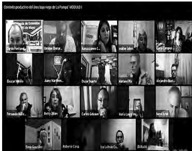
Última capacitación del EPRC por la plataforma Zoom: "Contexto Productivo del Área Bajo Riego en La Pampa".

En la época de aislamiento, el EPRC llevó adelante capacitaciones virtuales, como por ejemplo el reciente Webinar "Contexto Productivo del Área Bajo Riego en La Pampa", que se realizó estructurado en tres encuentros durante el mes de junio, por la plataforma Zoom.