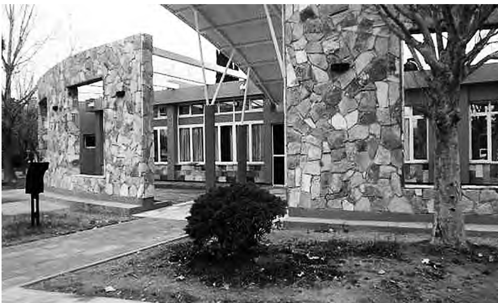
Sede del E.P.R.C. en la localidad pampeana de 25 de Mayo.

El 28 de junio de 1962 y por Decreto 21/62, fue creado el "Ente Provincial del Río Colorado" como organismo autárquico con capacidad de derecho público y privado, siendo su objetivo "...la promoción y aprovechamiento integral y acelerado del Río Colorado en jurisdicción de esta provincia, comprendida en su zona de influencia, en los aspectos tecnológicos,