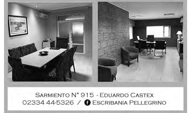
SARMIENTO N° 915 - EDUARDO CASTEX 02334 44-5326 / Escritania Pellegrino