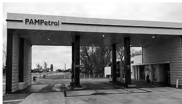
Con una ubicación privilegiada sobre la RN 35, Ataliva Roca dispone de una importante estación de servicios con la marca "Pampetrol", que están remodelando.