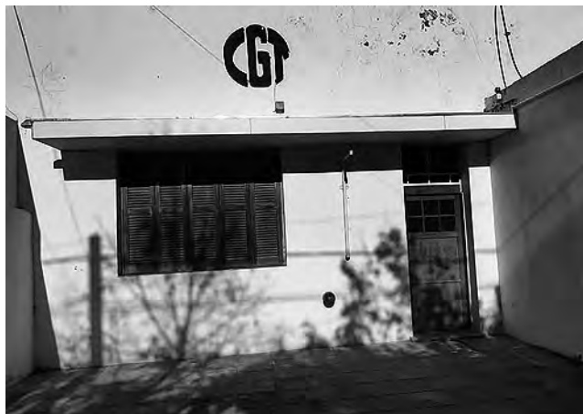
Histórica sede de la CGT Regional Zona norte en General Pico, ubicada en la centrica calle 18 entre 13 y 11.

"La CGT Zona Norte está representada en este momento por más del 90% de las organizaciones sindicales, este porcentaje está integrado y en este contexto nos comunicamos vía telefónica, acá nos conocemos todos los compañeros y cuando tal vez hay que tomar alguna decisión siempre es en vista de consulta entre las diferentes organizaciones, porque a su vez nosotros dependemos de nuestra organización madre, y siempre por la impronta de la negociación salarial, o las cuestiones de obras sociales que también es una cuestión que en este sentido es compleja, en la zona norte las prestaciones de las obras sociales tienen dificultades, no por el tema pandemia, si no por temas que viene de larga data, tal vez las obras sociales sindicales, inclusive prepagas también tienen problemas en la zona norte y en algunos lugares del país". "En esta cuestión nosotros como organización sindical (CGT) y como UPCN, también abarcamos a la gran mayoría de los trabajadores y trabajadoras de la salud que son nuestros soldados en el frente de la batalla, tal vez en algunos casos no recompensados pero sabemos del esfuerzo que ponen. Hablo además de la prestación de las obras sociales que necesi-