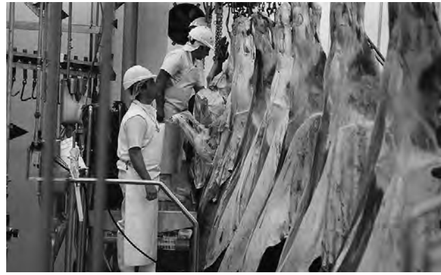
Para la gente de La Pampa el polo cárnico son las industrias de mayor capacidad de empleo en nuestra Provincia, los frigoríficos Carnes Pampeanas, General Pico y Speluzzi, toman promedio 450 trabajadores cada uno.

han sido absolutamente generosos tanto las cámaras empresariales, los gastronómicos, los industriales, como la CGT y las distintas organizaciones sindicales, gremios en forma individual de actividad, porque han entendido de que no había que profundizar diferencias, si no que había que acortar caminos de coincidencias para no seguir con la lógica de la destrucción masiva de