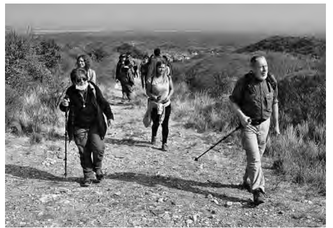
VIENE DE TAPA

Una temperatura media anual de 25 grados y la abundancia de días soleados, permite que esta localidad se erija todo el año como un destino ideal: tanto para quienes gustan de conocer los paisajes desde adentro en caminatas sin tiempo, en las que cada paso es un manantial de descubrimientos; como para quienes aman el turismo vivencial como un camino para expandir los límites del asombro y la curiosidad, además de los beneficios propios para la salud mental y física.