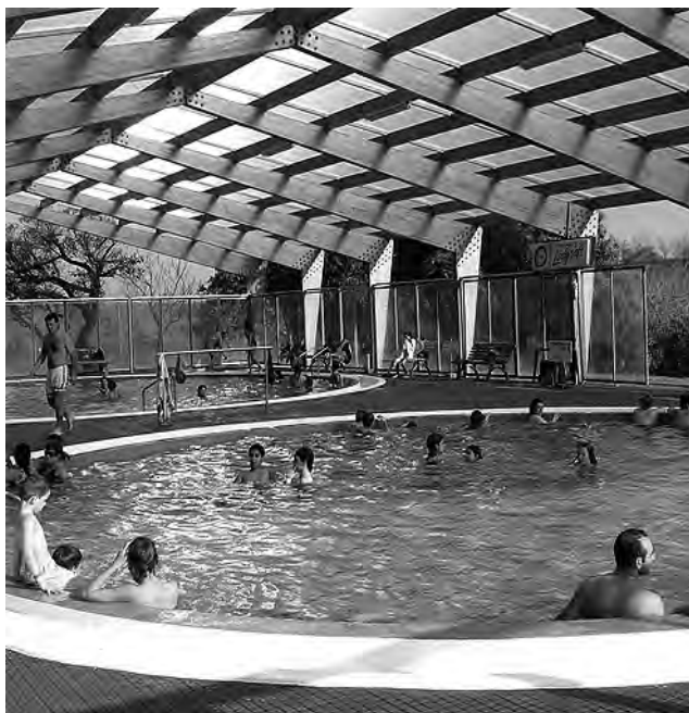
Las Termas del Dayman se encuentran a solo 10 km de la ciudad de Salto. Es un destino ideal para quienes buscan relajarse y disfrutar en tranquilidad.

Años tras años los argentinos eligen el país vecino para sus vacaciones o bien para una escapada de fin de semana. Ante la posibilidad de volver a cruzar el Río de la Plata, Punta del Diablo, Barra de Chuy, Colonia y Termas del Dayman son algunos de los lugares recomendados por Booking.com.