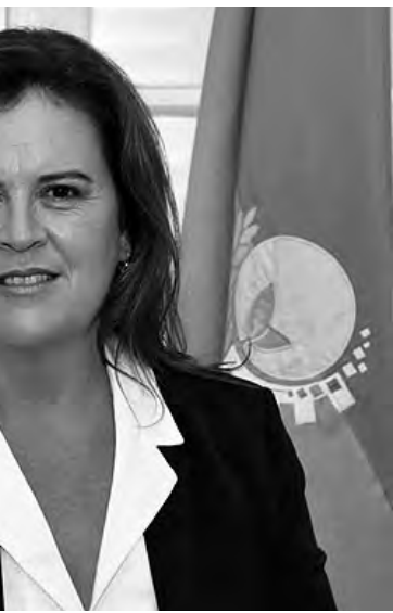
General Pico, destacó la... ó el Gobernador de que el... sea parte de los distintos... urbanísticos de General Pico".

desarrollo de esas 60 hectáreas. Y no tengo ninguna duda que vamos a encontrar el acuerdo necesario para satisfacer todas las necesidades. Porque tenemos que seguir construyendo viviendas, más allá de que ya se confirmaron 632 para General Pico, hay muchísima demanda".