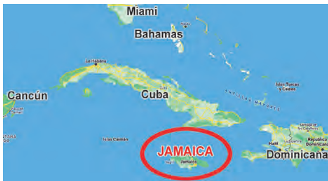
Jamaica, es una de las preciadas joyas del Mar Caribe.

Todo cambió hacia el 1800 con la pérdida de la industria del azúcar a nivel mundial.