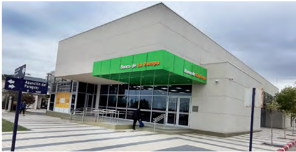
A la fecha el BLP cuenta con 41 sucursales y 60 agencias, de las cuales 27 son móviles. La última sucursal fue inaugurada en marzo de este año en Santa Rosa (Sucursal Norte), en la esquina de Av. Spinetto y Asunción del Paraguay (ver REGION Nº 1.483).

En la década del '70 volvió a reformarse su Carta Orgánica buscando enfatizar su rol de banca de fomento para el sector agropecuario, minero e industrial y darle más espacio a la acción social. La expansión hacia el interior provincial fue otra de las políticas prioritarias alcanzando 21 sucursales, una delegación y 13 agen-