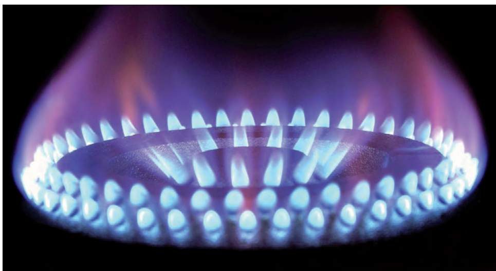
La llama de gas debe ser siempre de color azul; si la llama es amarilla o anaranjada, es signo de mala combustión y generación de monóxido.

Con los fríos del otoño y la llegada de la época invernal, se intensifican las consultas por patologías respiratorias y lamentablemente crece el número de fallecidos a causa de intoxicación por monóxido de carbono. Para lo cual, se considera sumamente indispensable advertir sobre los peligros de este enemigo silencioso que pasa desapercibido, ya que es inodoro,