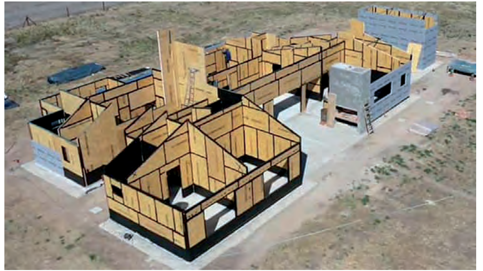
La empresa TAO Paneles de Neuquén, dará una charla virtual el martes 28 a las 18:30 hs. sobre “Construcción sistema SIP vanguardia en paneles”.

El Colegio de Arquitectos de La Pampa viene desarrollando desde el pasado martes 21, su 6ª Edición de las Jornadas de Arquitectura Pampeana “Construir conocimiento colectivo”, actividad que se extenderá hasta el próximo sábado 2 de julio, en el marco del “Día del Arquitecto Argentino” que se recuerda el 1º de julio. Las Jornadas -llevadas a cabo por el CALP en forma ininterrumpida durante 6 años-, consisten en charlas virtuales sobre diversos sistemas constructivos y fotografía, exposiciones de obras y croquis y recorridos urbanos en Santa Rosa y General Pico.