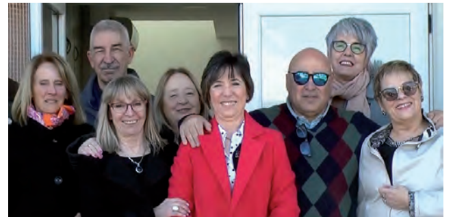
La alegría de un nutrido grupo de colaboradores, en la inauguración de la casa propia en Santa Rosa.