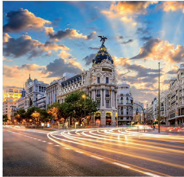
En Europa el destino estrella sigue siendo Madrid.

Otro destino de playa destacado es Punta Cana, donde