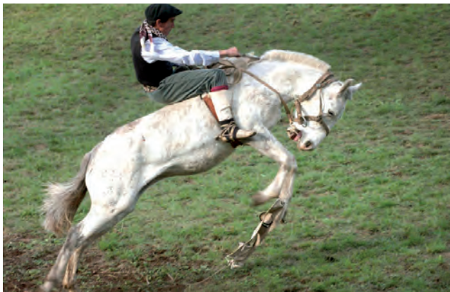
VIENE DE TAPA