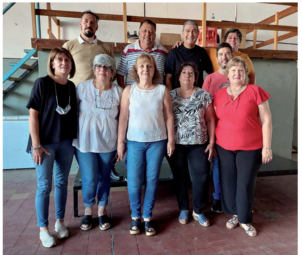
Actual Comisión Directiva de la Cámara Pampeana de Agentes Oficiales de Quiniela.