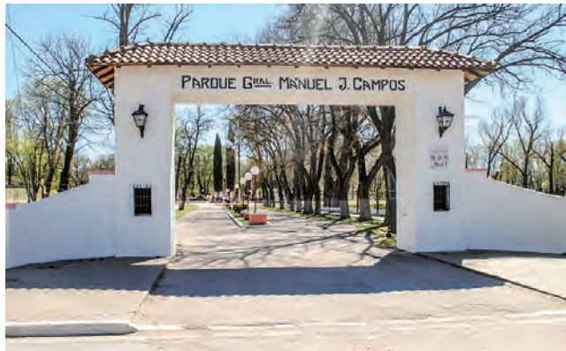
El Acto Protocolar por el 140° Aniversario de General Acha es este viernes en el Parque Manuel J. Campos.

Y la obra pública no se detuvo, y tenemos la expectativa de que no se detenga y seguir avanzando. El proyecto