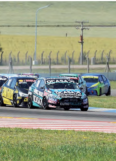
Clase 2 con un VW Gol Trend del equipo Giacone Competición.

Copa Abarth En el evento se correrá también la Copa Abarth Argentina, una categoría monomarca escuela para los pilotos más jóvenes, que disputará la séptima fecha.