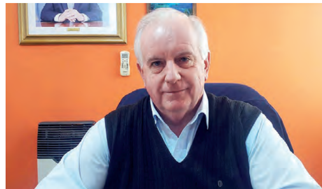
Giacomino destacó el acompañamiento del Gobierno Provincial en aspectos que hace al mejoramiento en los servicios de salud y de educación.

Giacomino destacó además el acompañamiento del Gobierno Provincial en aspectos