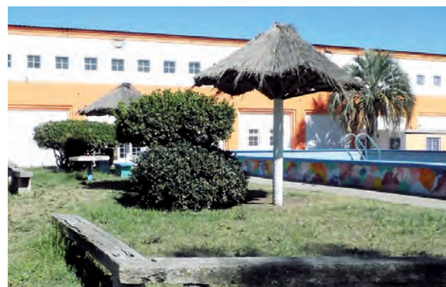
Con recursos propios han realizado diversas obras de mejoras de infraestructura, además de cordón cuneta, abovedamiento, badenes y trece cuadras de asfalto.