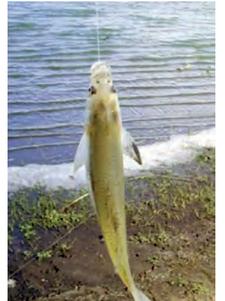
La veda parcial se extiende hasta el miércoles 30 de noviembre de este año y se puede pescar solo sábados, domingos y feriados.

La Municipalidad de Santa Rosa recuerda a la población en general y en particular a pescadores, que desde septiembre y hasta el 30 de noviembre de 2022, se dispuso la Veda de Pesca Parcial para la Laguna Don Tomás.