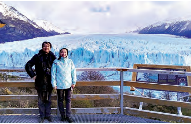
El gran mercado potencial chino representa unos 150 millones de turistas internacionales al año.

Patagonia nuevamente difundirá su oferta turística en medios periodísticos de la República Popular China. Periodistas de la Agencia de noticias Xinhua y del Diario del Pueblo realizarán un circuito por la Provincia del Chubut para generar contenidos que publicarán a través de estos dos importantes medios oficiales.