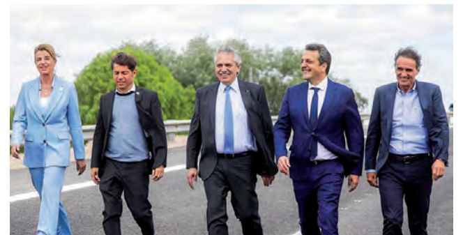
Autoridades nacionales en el acto en Cañuelas

Octubre Mes de concientización sobre el cáncer de mama