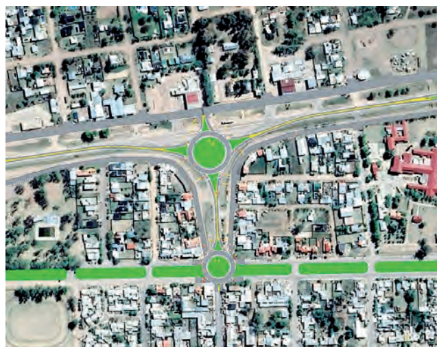
Obra programada "Travesía Urbana Gral. Acha"

"La travesía urbana de General Acha es una obra que, si bien parece algo puntual, integra una intervención mucho mayor, que tiene que ver con mejorar la calidad de vida de muchas y muchos argentinos", concluyó el Gobernador.