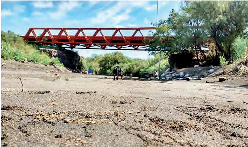
La Pampa reclama a Mendoza el caudal mínimo de 3,2 m3/s que dictaminó en 2020 la Corte Suprema de Justicia de la Nación. El acto central es en el Puente Los Vinchuqueros.

Bajo la consigna "La Pampa sigue reclamando los 3.2 mínimo permanentes", se realiza este viernes el acto central por el Día de la Reafirmación de los Derechos Pampeanos sobre el Río Atuel, en el Puente Los Vinchuqueros. Paralelamente, Recursos Hídricos y Cultura realizan diversas actividades en el Centro de Artes de Santa Rosa, que se replicará en otras localidades pampeanas como: Macachín, Algarrobo del Águila, Trenel, Realicó, Winifreda, Ingeniero Luiggi, Intendente Alvear, Catrillo, Rolón y Santa Isabel.