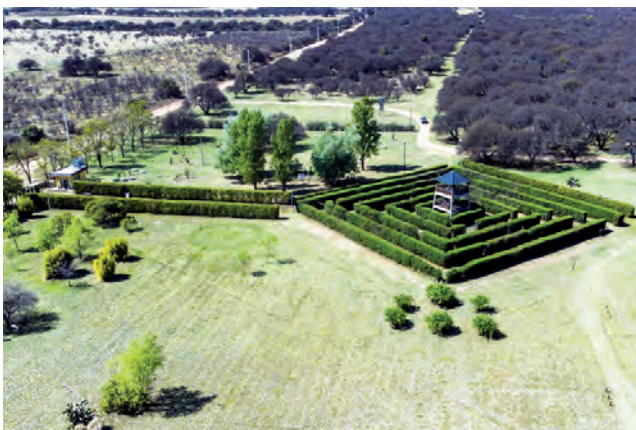
Vista aérea del del Jardín Botánico Provincial

El Ministerio de la Producción, junto a la Municipalidad de Toay, llevarán adelante la realización de la 10ª edición de la Expo Vivero 2022, que será este fin de semana del 22 y 23 de octubre en la sede del Jardín Botánico Provincial.