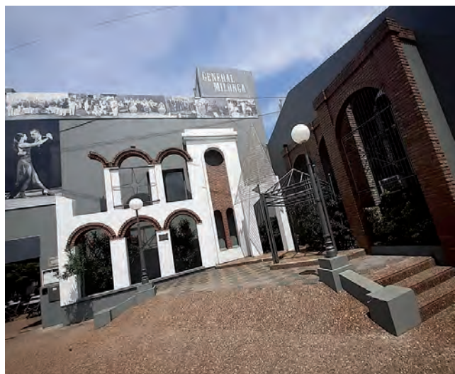
Si algo ha caracterizado a este pueblo, es el espíritu entre bohemio y festivo de su gente, que se remonta a los tiempos de aquel "General Milonga".

"Esta ciudad recorta su figura/ en un friso de silos y trigales,/ la arrulla el viento con sus madrigales,/ tiene una flor de cardo en la cintura. Por su verde distancia de