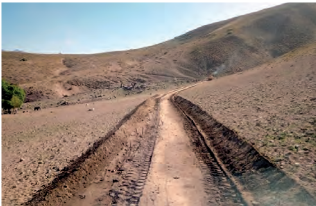
Los equipos de comunicación serán instalados en las localidades de Poti Malal y Las Loicas.

Atravesando las montañas de Malargüe, Vialidad Mendoza comenzó a abrirse camino para la instalación de antenas del sistema de comunicaciones Tetra, que utilizan las fuerzas de seguridad, brindando cobertura a toda la zona del Paso Internacional Pehuenche, al que se accede a través de las rutas nacionales 40 y 145 en Mendoza.