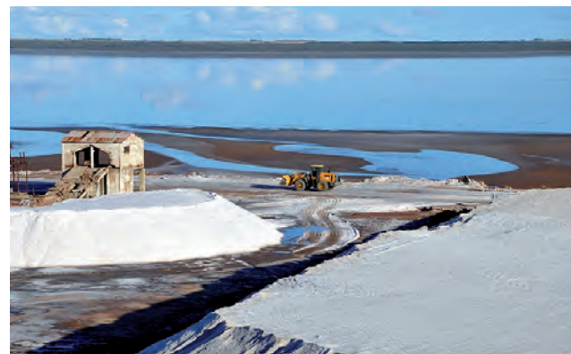
En La Pampa, Macachín comparte con las localidades de Jacinto Arauz, General San Martín y Anzoátegui (La Adela), la principal producción y explotación de sal.

La principal actividad económica local es la agroganadera, aunque también se destacan la industria láctea, la extracción de sal y la producción de harinas y derivados. Macachín nació siendo uno de los sitios más importantes de La Pampa, y hoy en día logró constituirse como un polo productivo que sigue creciendo y progresando, en el corazón del Sur-Este provincial.