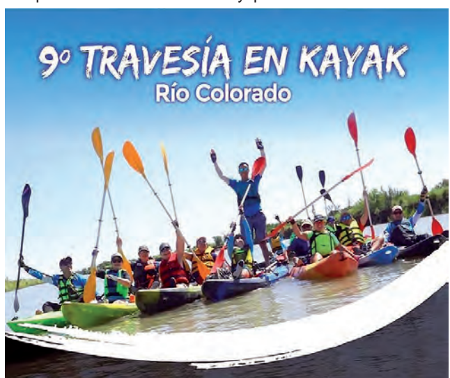
Entre las actividades del fin de semana que pasó, se desarrolló en Gobernador Duval la 9ª Travesía en Kayac por el Río Colorado con 100 kayakistas. La ocupación hotelera según la SecTur durante ese finde largo que pasó en toda la Provincia: Santa Rosa y Toay 100%; La Adela y Termas de Larroudé 90%; General Pico 80%; Victorica 70%; General Acha y Guatraché 50% y Realicó 40%.

-Las estancias que ofrecen servicios de turismo rural y alojamiento han manifestado muy buen nivel de ocupación, algunas de ellas completas con todos sus servicios ocupados. Claramente es una modalidad muy demandada en esta época, con la posibilidad de disfrutar y descansar en un entorno natural y tranquilo, además de una gastronomía de nivel muy apreciada.