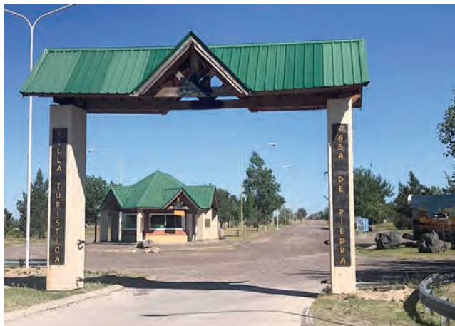
Ingreso a la Villa. Tiene un camping con todos los servicios, más zona de parrillas, restaurant y proveeduría

Casa de Piedra es la sede de la Unidad Demostrativa