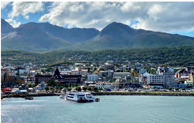
La ciudad de Ushuaia es uno de los destinos más elegidos de Tierra del Fuego