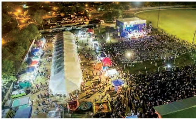
Intendente Alvear es la sede de una de las expresiones culturales más importantes de La Pampa: el Festival Nacional de Doma y Folclore entre enero y febrero.