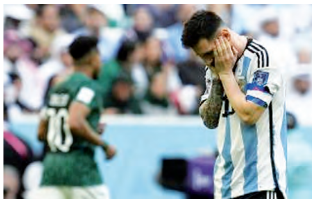
Un resultado desalentador de Argentina ante la caída con Arabia Saudita en el arranque de Qatar. Chau a la racha invicta de la Selección Nacional. En esta semana, dos partidos claves, contra México y Polonia.

Primer Mundial de fútbol organizado por la FIFA. Participaron Uruguay y doce seleccionados invitados (9 de América y 4 europeos). Se disputó íntegramente en Montevideo y duró 17 días. Argentina llegó a la final y perdió el título ante Uruguay, que se impuso por 4-2. El último gol fue convertido por Héctor Castro, quien fue llamado en el tiempo como el "Divino Manco" por su brazo sesgado desde los 13 años por una motosierra. Guillermo Stábile fue el go-