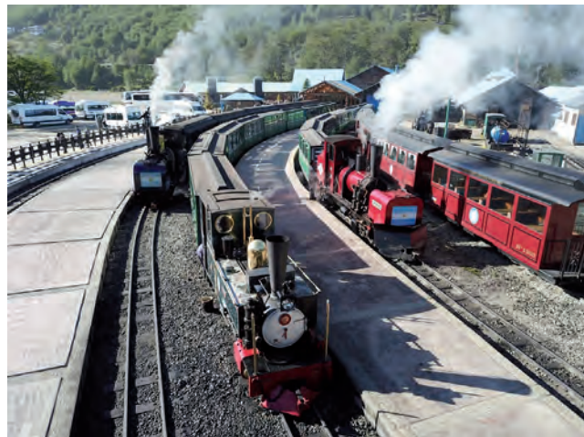
El "Tren del Fin del Mundo" conecta el Parque Nacional Tierra del Fuego con Ushuaia, pasando por tres estaciones al Oeste de la Ciudad.

La Argentina tiene el privilegio de contar con la provincia patagónica de Tierra del Fuego, Antártida e Islas del Atlántico Sur -tal cual es su nombre completo-, donde se terminan los caminos pero abundan las experiencias. Tierra del Fuego cuenta con