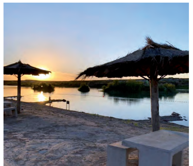
La Villa cuenta con variadas opciones de recreación, donde se destaca la oferta más apreciada de Río con playas.

Representates comerciales de 5 países sudamericanos visitaron hace pocos días Casa de Piedra, en una Misión Comercial Inversa del Sector Vitivinícola para la Región Patagonia que organizó el CFI, junto a COVIAR, la Agencia I-COMEX La Pampa, el EPRC y la SecTur