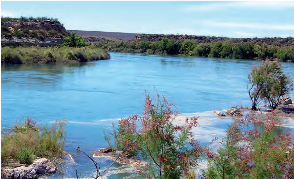
Los Miradores Panorámicos, ubicados frente a la represa y la Villa Turística, son una visita recomendada en cualquier época del año, con vistas imponentes a varios metros de altura.

El origen de la fundación de la actual Villa fue la sanción de la ley provincial N° 2.112 (23/07/04) que dio lugar a la creación del Ente Comunal Casa de Piedra, cuyo objetivo es la instalación de la infraestructura básica para un centro urbano de servicios, vinculado con el potencial turístico y productivo, aprovechando el lago originado por la Presa Embalse Casa de Piedra.