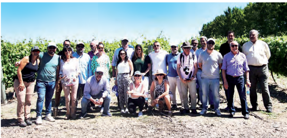
Recientemente una Misión Comercial Inversa del Sector Vitivinícola para la Región Patagonia, trajo a Casa de Piedra a importadores, sommeliers y periodistas del rubro vitivinícola de Colombia, Costa Rica, Paraguay, Ecuador y Perú.