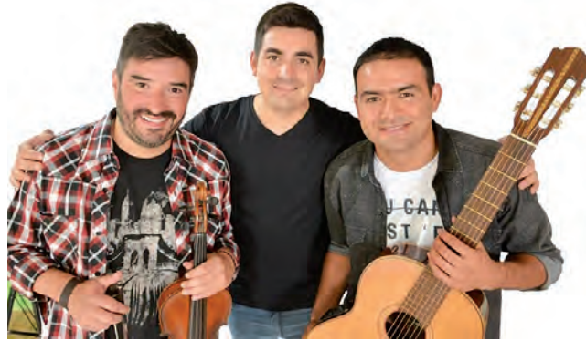
Entre los shows en vivo, actuará el "Trío Sachero"

Este sábado 18 de febrero a partir de las 19:30 hs. la localidad pampeana de Coronel Hilario Lagos está de festejos por su 112° aniversario, que fue un 19 de febrero de 1911.