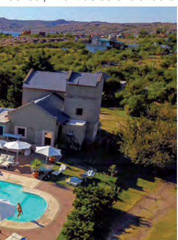
...e Amboy, "Aguada de Luna"

...sus cúpulas se caracteriza por la disposición de amplios ventanales que proveen luz solar. Cada espacio cuenta con baño privado, ducha con agua caliente, cama king size o twin, living, calefacción, frigobar de campo, deck privado, wifi y hamaca. A propósito de amenities, Aguada de Lunas ostenta un sistema all inclusive de comidas que provee desayuno, picada, almuerzo, picnic, vermú y cena. Estos momentos se comparten en su restaurante, un salón de té o un bar de mate que se ubica bajo una frondosa arboleda. En el establecimiento también funciona una vermutería, un espacio ideal para intercambiar tragos, bebidas y aperitivos durante la caída del sol, mientras se enciende el