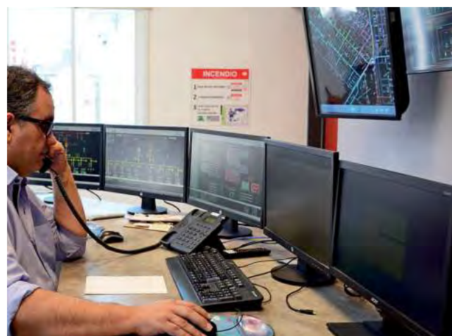
Hay un sistema automático de respuesta telefónica ante posibles cortes. Pero también hay atención personal.

Otro de los sectores importantes del Centro de Control es una oficina dedicada a analizar nuevas tecnologías. Una suerte de laboratorio donde se ensayan novedades que están circulando en el mundo para ser incorporadas tanto al SCADA como a otras aplicaciones y sistemas que utiliza la cooperativa.