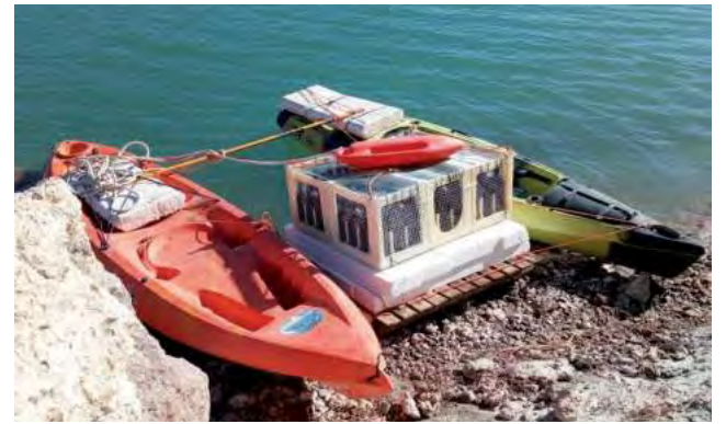
Los envases estarán en el fondo del río durante un año, a unos 7 metros de profundidad.

El Ente Provincial del Río Colorado (EPRC) informó en su página de Facebook que el grupo de amigos que el año pasado añejó 72 botellas de un vino pampeano en el lecho del río Colorado, muy cerca de Casa de Piedra, volvió a repetir la experiencia a principios de mayo, solo que esta vez sumergió un número mucho mayor: 288 botellas.