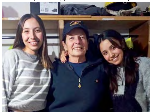
Muchas mujeres le han escrito y se sienten orgullosas de ver a "Toti", quien afirma: "Siempre la labor comunitaria que realizo lo hago de corazón porque lo siento, ahora hay mujeres que están a cargo de otras Jefaturas".

primer curso que realicé fue Psicología en Emergencia en Buenos Aires, entonces me sentía sorprendida y me llenaba de orgullo porque todo el mundo quería sacarse una foto conmigo a todos les llamaba la atención una Jefa de Cuartel de Bomberos, incluso los compañeros de General Pico me decían que había