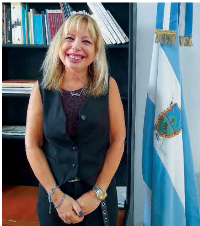
Vicedecana Diner: Están previstas la I Jornada Nacional sobre la Enseñanza de las Ciencias Contables, los días 12 y 13 de junio en la FCEyJ, donde convocamos a participar con ponencias y además se va a brindar una capacitación sobre las nuevas resoluciones técnicas contables.

También, ante una demanda de capacitación de personas que trabajan en diferentes entes de la administración pública, se está por iniciar el dictado de la Tecnicatura en Administración y Gestión Pública. Es una nueva ca-