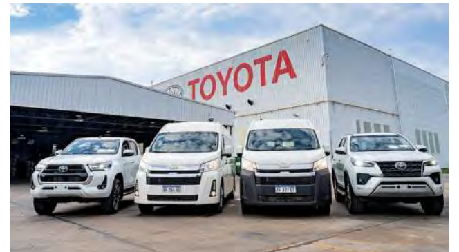
HIACE en dos versiones: Furgón L2H2 y Commuter para pasajeros, compartirán autopartes y componentes con la pickup Hilux y el SUV SW4, también fabricados en Zárate.

Luego de 26 años en el país, Toyota anunció la producción de un tercer vehículo en su planta de Zárate, el utilitario HIACE. La compañía ya comenzó con la construcción de una nueva nave industrial para producir el vehículo comercial en sus versiones Furgón L2H2 y Commuter -pasajeros-, a partir de enero de 2024. Con una inversión de US$ 50 millones, el volumen de producción durante su primera etapa rondará las 4.000 unidades, con un potencial de 10.000 unidades anuales a mediano plazo.