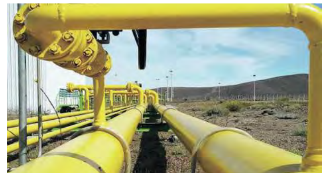
En este Tramo 1, entre Vaca Muerta y Salliqueló, el GPNK atravesó 573 km por cuatro provincias. El Tramo 2 a licitarse este año, continuará por 467 km más desde Salliqueló hasta San Jerónimo en el sur de Santa Fe.

La operatoria del nuevo ducto estará a cargo de la compañía transportadora TGS, con la cual Enarsa firmó en las últimas semanas un contrato de cinco años. TGS tendrá a su cargo la operación y mantenimiento de la primera etapa del gasoducto. Además, en los próximos meses se realizará la licitación del Tramo II del gasoducto que continuará la traza por otros 467 kilómetros desde la localidad bonaerense de Salliqueló, hasta San Jerónimo, en el sur de Santa Fe.