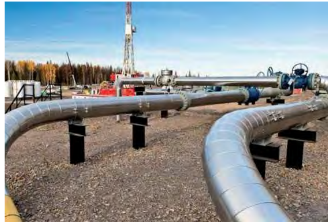
La obra de ingeniería atravesó cuatro provincias, desde la planta de tratamiento de gas en la neuquina Tratayen, emplazada en el corazón de Vaca Muerta, pasando por Río Negro y La Pampa, hasta Salliqueló.

Para el tendido se soldaron en promedio 5 kilómetros de caños por día en los tres frentes de obra, y por primera vez se utilizaron en la Argentina soldadoras automáticas, la tecnología más avanzada a nivel global que reduce los tiempos de obra.