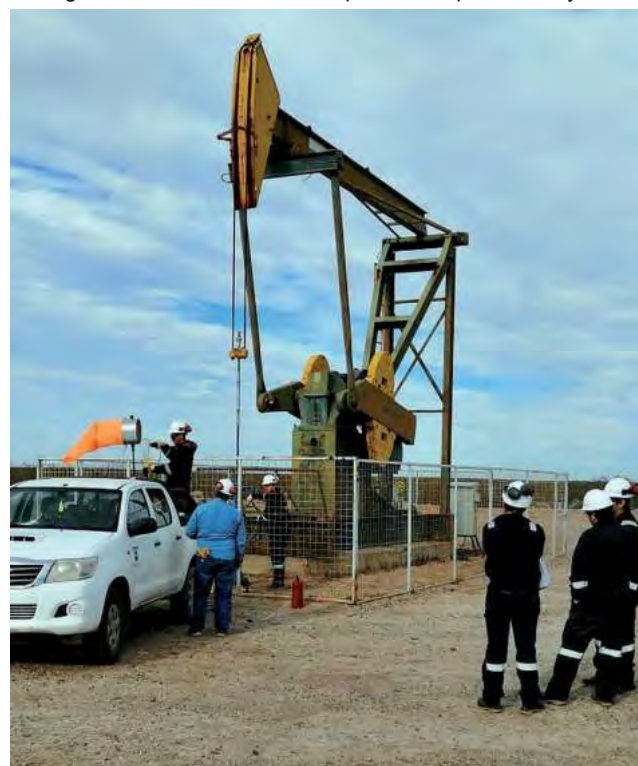
La Pampa es uno de los pocos estados argentinos que tienen producción de petróleo, el cual se obtiene en este área marginal al Río Colorado, siendo el EPRC también, la autoridad de aplicación al respecto.

También hay que destacar, como otro perfil importante de la zona, que la provincia de La Pampa es uno de los pocos estados argentinos que tienen producción de petróleo, el cual se obtiene en este área marginal al Río Colorado, siendo el EPRC también, la autoridad de aplicación al respecto.