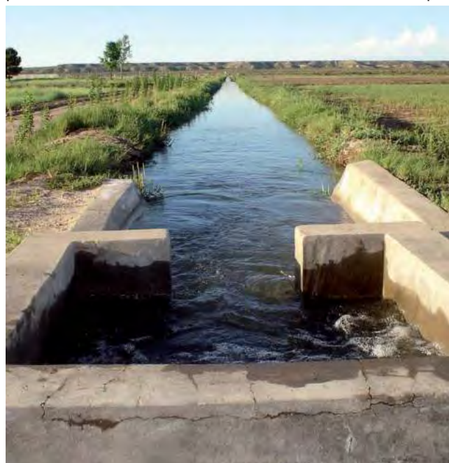
El EPRC tiene bajo su control cuatro sistemas de aprovechamiento agrícola: El Sauzal, Planicie Curacó, Valle del Prado y Bajo de los Baguales y un sistema de aprovechamiento múltiple, el de 25 de Mayo.