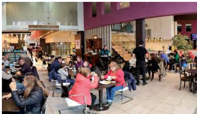
El local de Av. San Martín funciona como cafetería, panadería, helados artesanales y la posibilidad de almorzar.

Ahí actualmente funciona como cafetería, panadería, helados artesanales y el último servicio que es la