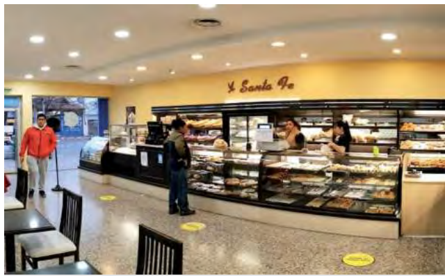
Arrancaron en Santa Rosa en 2003 y en el 2009 se instalaron en el actual local de Avenida Luro 679. Luego en 2011 se ampliaron con otro local en Av. San Martín. Y ahora en breve, abrirán una heladería frente al Centro Cívico.

"Ya en el 2009 decidimos buscar otro local mejor ubicado. Ahí nos mudamos al actual de Avenida Luro 679 y en esta dirección agregamos el servicio de confitería. La panadería está funcionando muy bien, el pan y los pani-