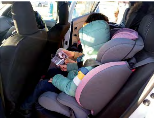
VIENE DE TAPA

Desde el lunes 10 la Agencia Nacional de Seguridad Vial (ANSV) entrega Sistemas de Retención Infantil (SRI) o sillitas a los conductores que se trasladen por Bariloche con niños sin la protección adecuada durante las vacaciones. Se trata de una campaña de concientización del organismo del Ministerio de Transporte para visibilizar la importancia -y obligatoriedad- del uso de las sillitas infantiles para el traslado seguro de los menores de 10 años, que se desarrollará durante el Operativo Invierno 2023.