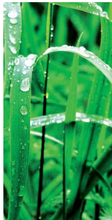
Los cambios en las lluvias y temperatura que sucede con el fenómeno de El Niño y otros fenómenos que pueden ser influenciados por el Dipolo del Océano Índico.

También tiene un comportamiento cíclico con una fase negativa, neutral y otra positiva,