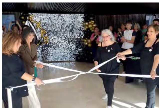
Corte de cintas al inaugurar la 8ª Edición de la Expo.

También la titular de la Sec-Tur felicitó a las asociaciones y fundaciones presentes por la importante labor que desa-