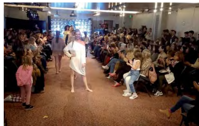
Desfile Show, con 80 modelos en escena.