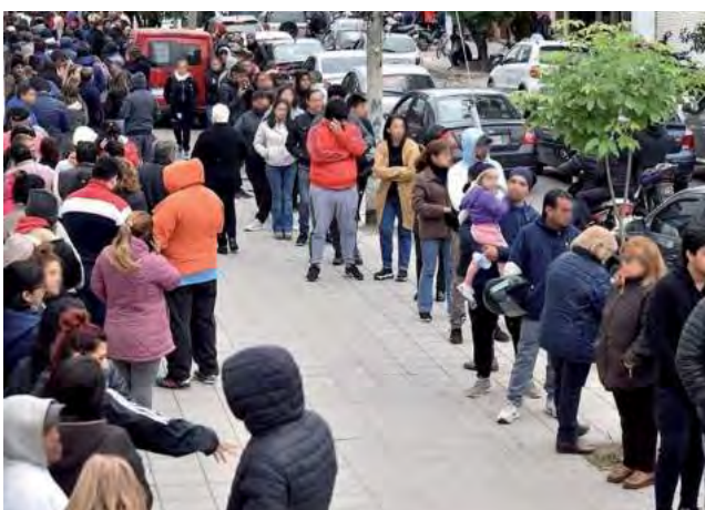
Lo importante: Este domingo hay que ir a votar.