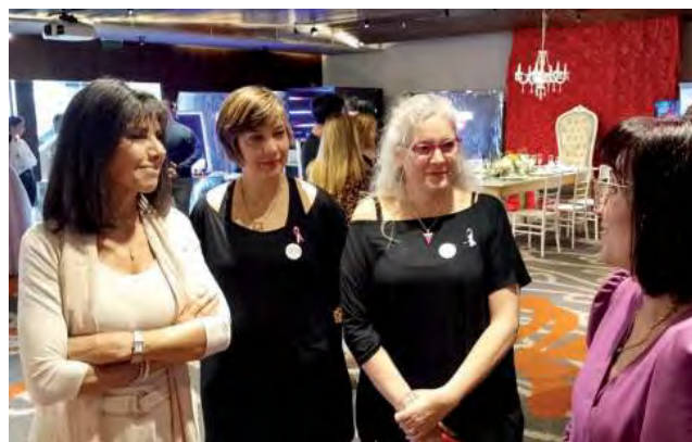
Recorrida inaugural por los stands expositores.