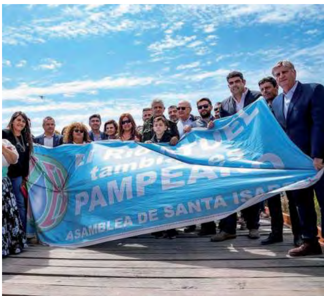
El Gobernador solicitó estar acompañado por intendentes e intendentes de la zona y por instituciones que luchan en defensa de los ríos pampeanos.

Tras la reanudación de la actividad judicial en el fuero nacional, el gobernador Sergio Ziliotto, a través de la Fiscalía de Estado, requirió se fije audiencia presencial a fin de poder concurrir junto con los intendentes de las zonas afectadas del oeste pampeano y las Asociaciones Civiles intervinientes con el objetivo de que puedan exponer en el presente proceso el estado de situación actual del cauce y los daños socio-ambientales generados y a generarse. Igualmente, que puedan manifestar al Tribunal los conflictos diarios que deben resolver a raíz de la faltante de agua y como esta situación se agrava día a día, generando éxodo de las poblaciones y graves problemas sociales.