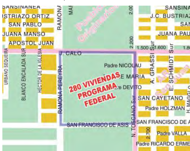
“Guiaplano REGION®” 15ta Edición.

Además, en el lugar se ha determinado que haya tres espacios verdes y las viviendas contarán con todos los servicios esenciales, como son agua potable, gas natural, cloacas y energía eléctrica.