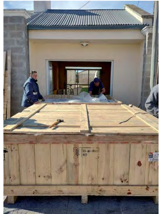
El material llegó desde España por gestiones del gobierno de la Provincia a través de la Secretaría de Cultura

Tal como se había adelantado desde el Gobierno Provincial, el sábado pasado llegó a Rancul parte del legado material de Alberto Cortez. En breve equipo de la Dirección de Patrimonio Cultural visitará la localidad para abrir las cajas y hacer un inventario de la obra.