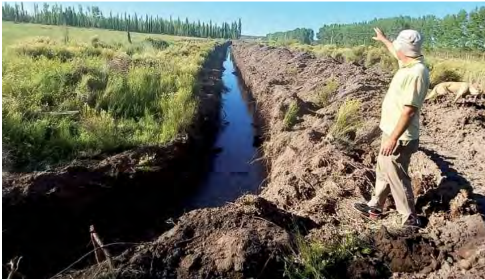
El inicio del Ciclo de Riego 2023 permitirá este año, la provisión de agua a más de 12.000 hectáreas que comenzaron su ciclo productivo en la zona de El Sauzal y 25 de Mayo.

El mantenimiento anual de la red de riego, drenajes y caminos de servicio, que comprende todas las tareas de operación, administración, mantenimiento y