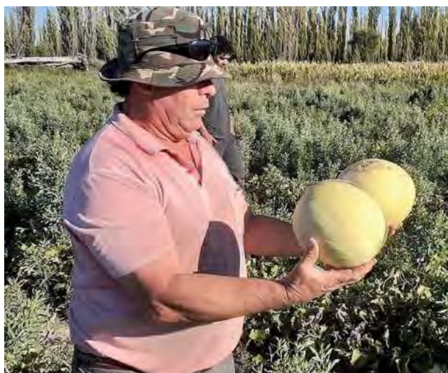
Las producciones bajo riego, abarcan las relacionadas a la agricultura, frutihorticultura y vitivinicultura.