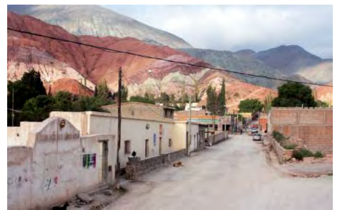
Cerro de los Siete Colores en el pueblo de Purmamarca, distante a tan solo 25 kms. de Tilcara.

Depende. Si tenés Personal sí, si tenés Claro puede ser, si tenes Movistar no. Pero si necesitás conexión no te preocupes, en la plaza del centro hay WiFi libre por una hora para que puedas comunicarte, y la mayoría