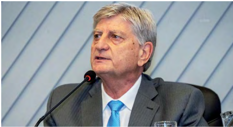
Sergio Ziliotto, al asumir su segundo mandato al frente de la gobernación de La Pampa.

Dijo que "hoy es un día especial, con sensaciones distintas. Hablar de Democracia significa hacer una retrospectiva, pero también mirar para adelante. 40 años de muchas luchas para sos-