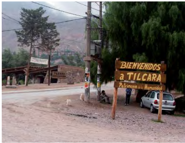
Desde Santa Rosa en auto hasta Jujuy son 1.520 Kms. Lo recomendable es hacer avión desde Buenos Aires -hay buenas ofertas- y alquilar vehículo en el destino.

El punto neurálgico de Tilcara es la plaza Coronel Manuel Álvarez Prado, y la Av. Belgrano. A Tilcara se ingresa por la Av. Villafañe, que conecta con la Av. Belgrano