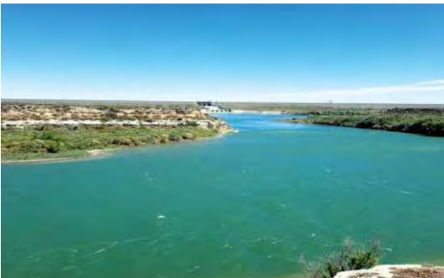
Desde el 24 de noviembre, el caudal del río Colorado en la estación de referencia de Buta Ranquil viene superando los 400 m3/s.

En correspondencia con los pronósticos publicados por COIRCO, los caudales en Buta Ranquil superaban la semana pasada los 500m3/s. Las acciones preventivas tomadas evitaron inconvenientes en áreas urbanas, productivas y petroleras. El embalse Casa de Piedra está mejorando la reserva de agua.