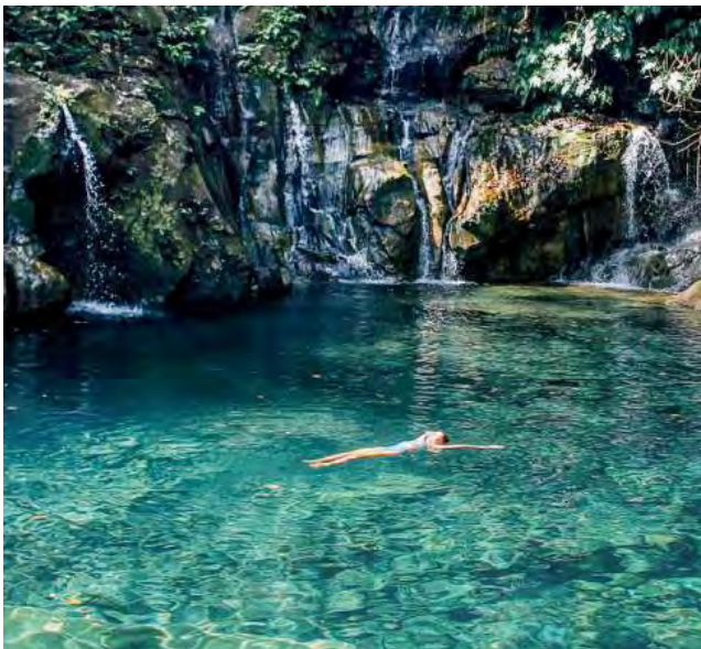
La ciudad de Carolina, ubicada en el estado de Maranhão, Brasil, es una joya turística a descubrir.