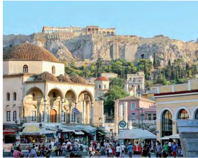
La capital de Grecia recibió el nombre de Atenas en honor a la diosa Atenea, una divinidad de la mitología griega conocida como la diosa de la sabiduría.

En el Mes de la Mujer y en el contexto de los viajes, para honrarlas, Booking.com la plataforma más importante a la hora de reservar alojamientos en todo el mundo, destacó seis destinos que