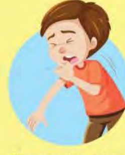
Cansancio, dolor en las articulaciones