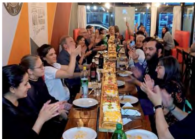
Los súper Mix, el mismo sabor pero gigante!