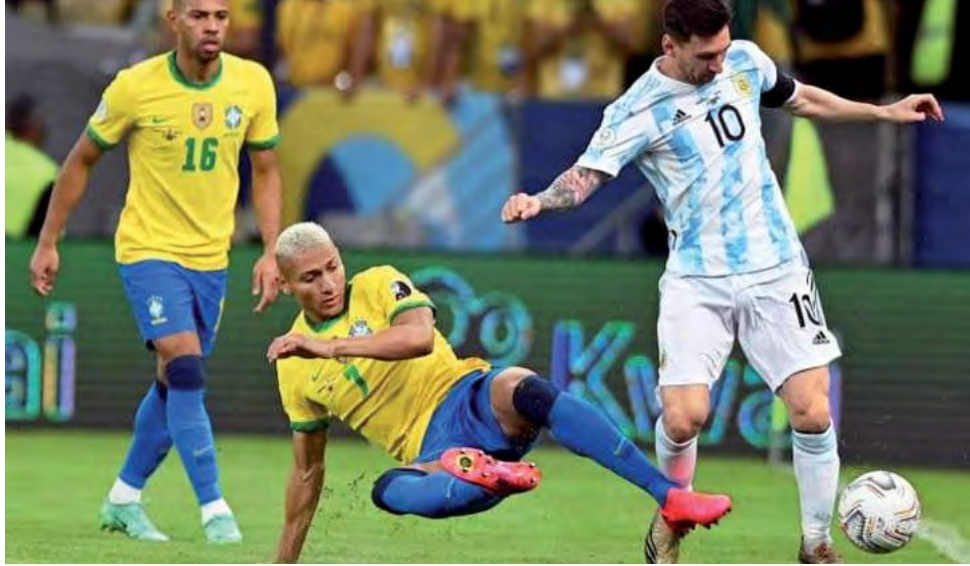
Se acerca uno de los eventos deportivos más esperados por los hinchas de la selección en Estados Unidos, un país que eligen alrededor del 30% de los viajeros.

Esta edición de la Copa América tiene a Estados Unidos como anfitrión, aunque pueda ir variando durante el año, se trata de un destino que es elegido por alrededor de un 30% de los viajeros de Almundo para sus vacaciones. Entre las ciudades más visitadas se destacan: Miami,