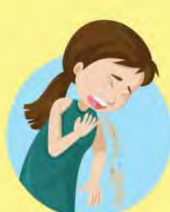
Vómitos y náuseas