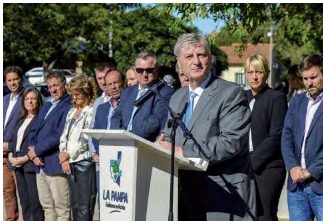
El gobernador Sergio Ziliotto, en su discurso, reivindicó la política de Derechos Humanos de La Pampa desde la recuperación de la Democracia en 1983.

El gobernador de La Pampa Sergio Ziliotto encabezó el acto por el Día de la Memoria por la Verdad y la Justicia en Jacinto Arauz, al cumplirse 48 años del último golpe de Estado. "En estos tiempos difíciles, hay que ratificar una vez más que son 30.000, son