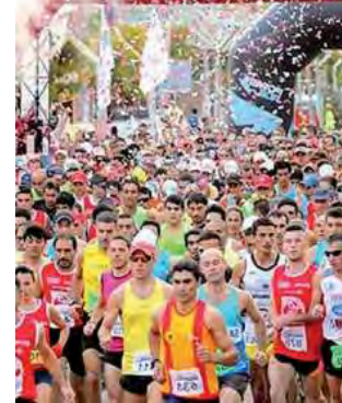
-Dom. 14 desde las 8 hs: largada Maratón Internacional A Pampa Traviesa

• Centro de Artes : Leguizamón 1.125 -Dom. 14 a las 16 hs: Junta de Juegos. -Continúa la muestra "Silencio, los hombres no lloran" del artista pampeano Nika Senora. • Centro El Fortín - Toay -Sáb 20 y dom. 21: 18ª Semana Gaucha. Destrezas criollas, tropillas, peña, baile • Casa Museo Olga Orozco - Toay -Lun a vie. de 9 a 17hs. Sáb. y dom. de 17 a 20hs: Recorrido autoguiado gratuito.