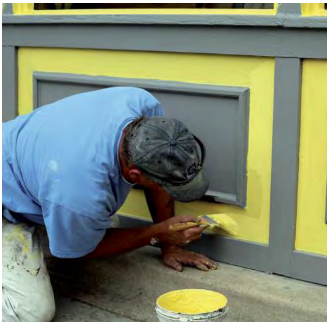
La propuesta es del 8 al 15 de abril en todo el país y el descuento se aplicará en todos los productos Sintoplast.

Cambio, cambio, no es un arbolito ni un partido de fútbol es los que piden esos espacios que necesitan vida y color para mejorar el estado de ánimo. Por ello, en la Semana de la Pintura, del 8 al 15 de abril, Colorshop ofrece descuentos de hasta el 35% en todos los productos Sintoplast.