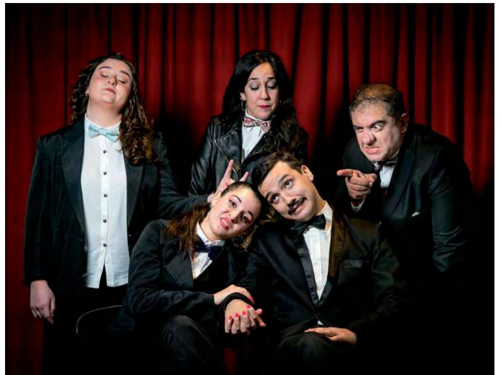
Las entradas anticipadas ya están a la venta en la Ticketera Web del Teatro Español

En su gira provincial por Mendoza se presentó en San Carlos, Maipú, Tunuyán, Rivadavia y en el Festival de Humor de Las Heras. Inician su "Gira Patagónica 2024" por las ciudades de Neuquén, Santa Rosa y Bahía Blanca. Y se está pre-produciendo la gira internacional que los llevará a Chile, Perú y Ecuador