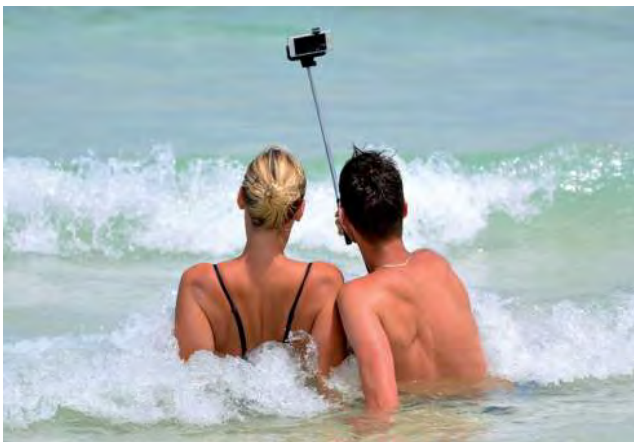
Para el 46% de la comunidad viajera argentina las fotos mantienen viva la llama de las vacaciones.