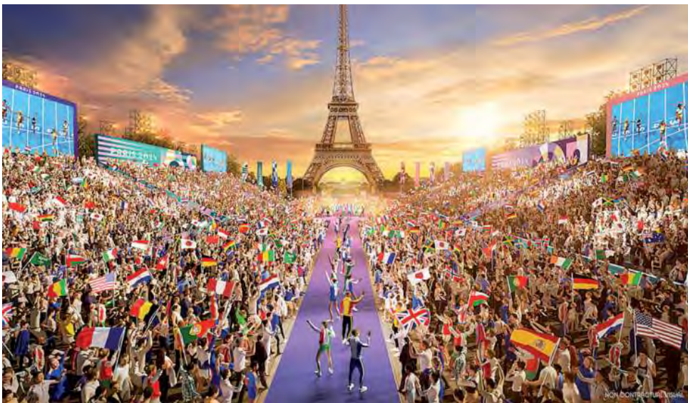
La carrera forma parte del Campeonato Nacional de Maratón, clasificatorio para los Juegos Olímpicos de Francia "Paris 2024", que será del 26 de julio al 11 de agosto.

Las autoridades confirmaron también que la carrera forma parte del Campeonato Nacional de Maratón, clasificatorio