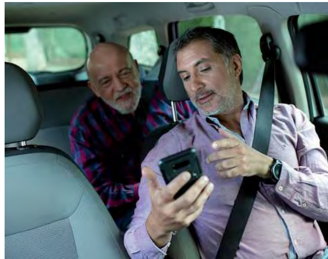
La disponibilidad de la app de Uber brinda oportunidades de generar ganancias a todas las personas que se registren para manejar y ofrecer viajes, incluyendo a taxistas.

A más de ocho años del primer viaje realizado por medio de la app en el país, Uber anunció su próximo lanzamiento en Santa Rosa. Además hoy se suman cinco ciudades más: Tandil, El