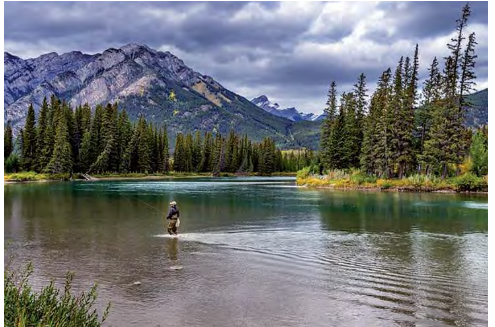
Muchos viajeros cuando piensan en sus vacaciones eligen alejarse de las grandes urbes y vivir nuevas aventuras, explorando la naturaleza con actividades al aire libre como senderismo, esquí o pesca.

De hecho, el 36% de los argentinos indicó que viajó para encontrarse con la naturaleza, pasar un tiempo al aire libre visitando parques