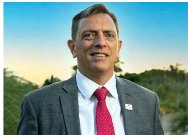
Según García Malbrán, el mercado inmobiliario argentino está mostrando claros indicios de recuperación.