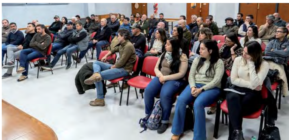
En la reunión "se trató de potenciar la vinculación entre los diferentes actores públicos y privados involucrados en esta actividad", señalaron.

A su vez agregó que "la caza deportiva lleva un gran camino recorrido y en esta oportunidad aprovechamos este valioso encuentro para