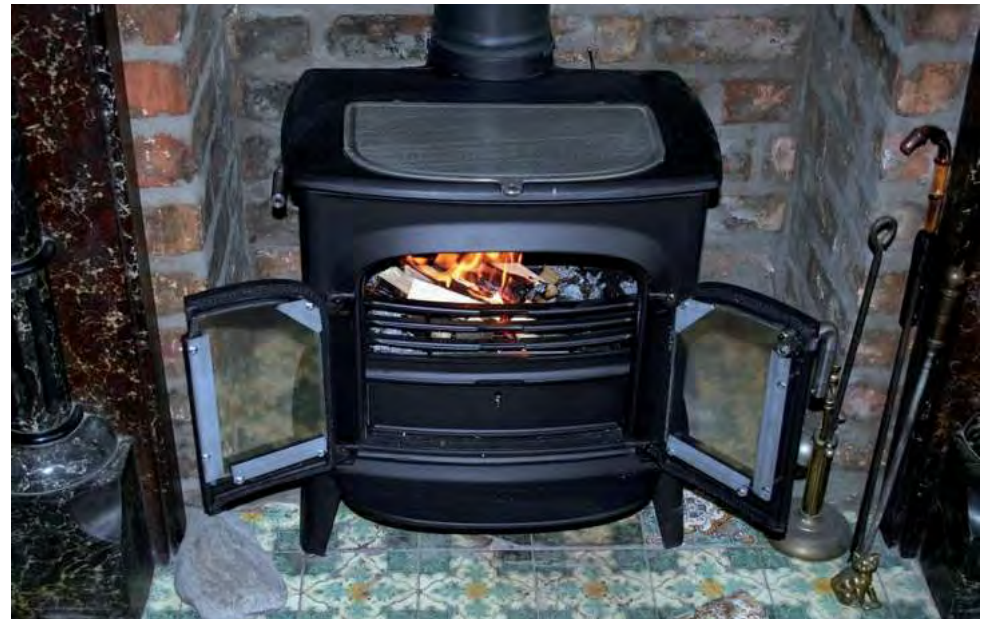
La intoxicación por monóxido de carbono constituye la causa más frecuente de envenenamiento para todas las edades y entornos sociales, tanto en nuestro país como a nivel mundial.

Otras fuentes son los braseros, los hogares a leña,