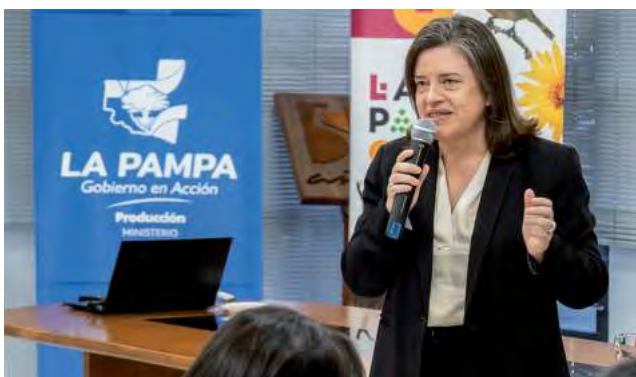
La ministra González expresó: "la caza deportiva lleva un gran camino recorrido y en esta oportunidad aprovechamos este valioso encuentro para una vez más, ofrecer nuestro acompañamiento desde el gobierno provincial al sector privado, e intercambiar opiniones y sugerencias que lleven a la mejora continua del desarrollo de la actividad".

Para cerrar se dio lugar a un productivo intercambio entre los representantes del Gobierno pampeano y del sector privado, en pos de la actividad cinegética provincial.