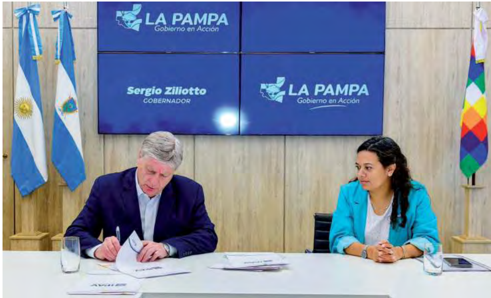
La inversión para estas 280 primeras viviendas contratadas en Santa Rosa, es de unos 16 mil millones de pesos y hay otras 700 viviendas más programadas en vías de ejecución.

El Gobierno Provincial se hace cargo, con fondos propios, de la construcción de viviendas sociales que dejó de financiar Nación. La inversión llega a los 16 mil millones de pesos. "Vamos a hacer el mayor esfuerzo posible para seguir invirtiendo en obra pública porque sabemos el rol que tiene el Estado como dinamizador de la economía", aseguró el Gobernador ante los representantes de las empresas constructoras, pero aclaró que se continuará "reclamando que Nación cumpla con el financiamiento de los convenios firmados".