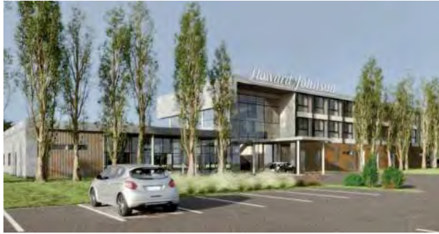
El nuevo HJ de Pico tendrá 40 habitaciones, 20 estándar y 20 Junior Suite, tendrá restaurante, spa, piscina climatizada, gimnasio, estacionamiento y salones varios.

La cadena hotelera Howard Johnson que hace muchos años atrás intentó instalarse en la capital pampeana, sobre la Ruta Nacional N° 5, esta vez se decidió por desembarcar en la ciudad de General Pico, sumando una nueva provincia a su red en el país. La novedad fue anunciada por el Grupo Hotelero Albamonte (GHA) y la obra edilicia estaría terminada para fines de 2025.