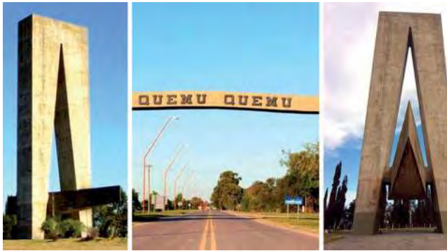
La localidad pampeana de Quemú Quemú, cumple 116 años desde su fundación, ocurrida el 26 de Julio de 1908.

Situada en el departamento de su nombre, Quemú Quemú es una importante localidad del Este pampeano, ubicada sobre la ruta provincial N° 1.