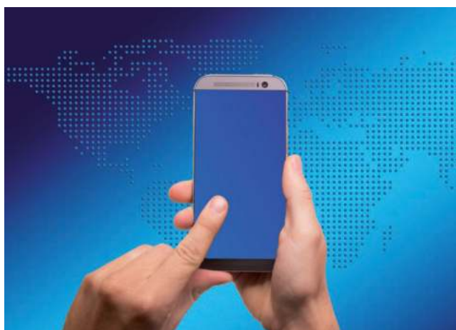
Desde gastar de más excediendo el presupuesto, hasta quedarte sin comunicación o exponer tu información a sitios peligrosos, estos errores pueden hacerte pasar un mal rato durante un viaje.

Para eso, también se debe llevar un control desde la app de tu cuenta bancaria, esto con el fin de estar al tanto de todos los movimientos que hagas, tu saldo restante, así como posibles cargos no reconocidos.