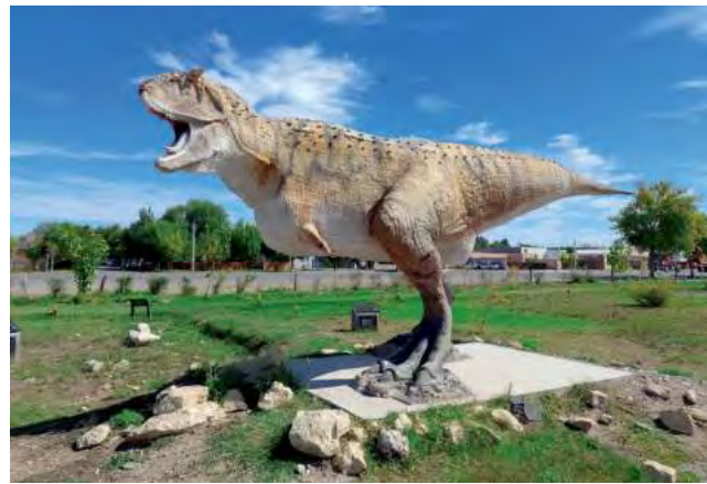
El "Parque Cretácico 25" es una visita que se destaca en el recorrido por la Ciudad.

Este viernes 26 de julio, la localidad pampeana de 25 de Mayo, cuyo intendente es Lionel Monsalve, recuerda su 115º Aniversario. La fecha corresponde al reconocimiento del Gobierno Nacional hace más de un siglo atrás, de la población que ya existía.